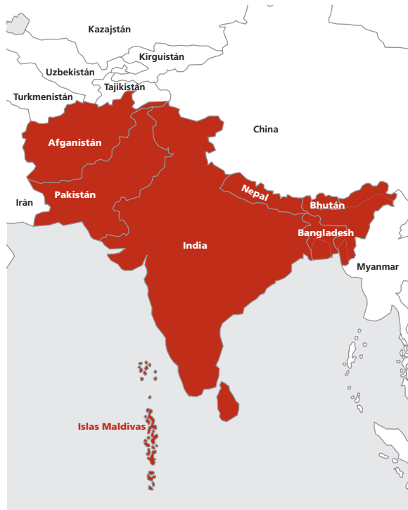
MAPA 1. La visión india del Asia Meridional